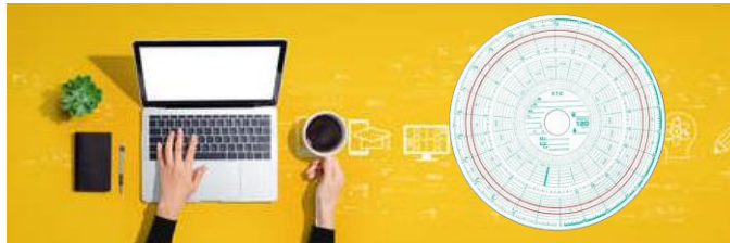
運行管理システム